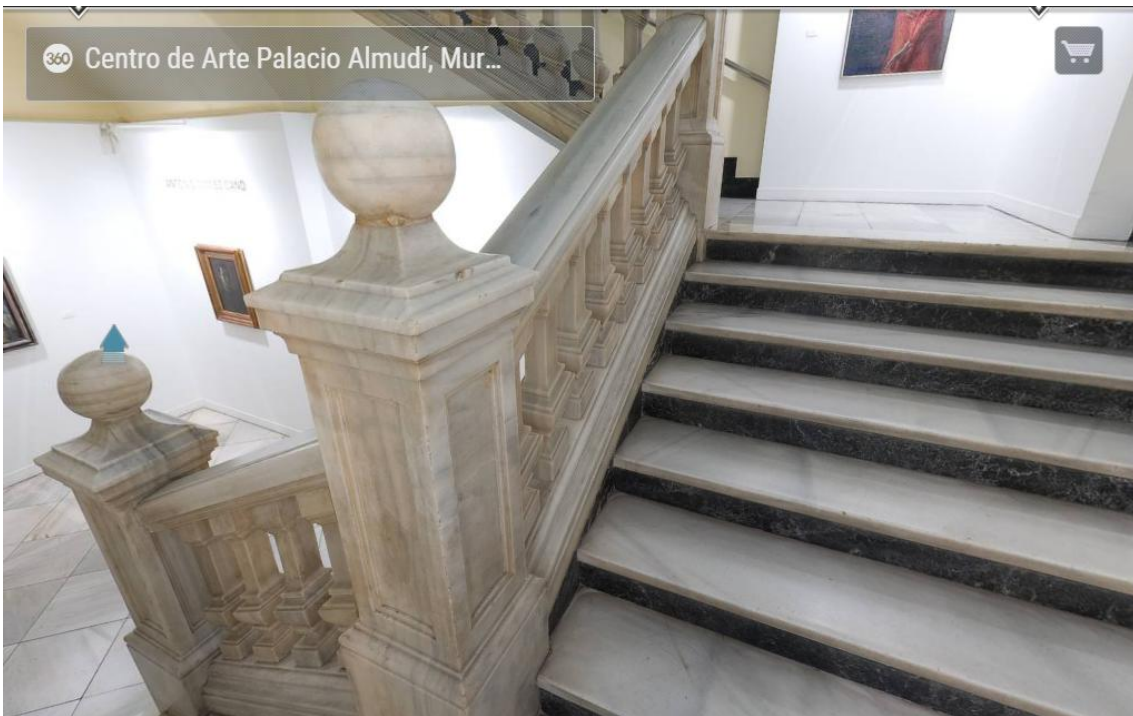
Escalera a planta alta

Enlace vista 360º de escalera interior: https://www.360cities.net/image/almudi4