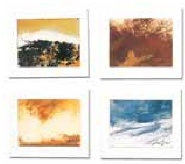
GÉNESIS FRISO IV (44 piezas) óleo/papel 4'5x6 cm (cada una)