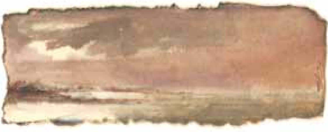
GÉNESIS acuarela/papel 6x17 cm

hablando de la transcripción sentimental de lo que es invisible. De lo incorpóreo, de lo eterno, de lo inmutable, de lo auténtico. Conceptos, abstracciones que el pintor irá acrisolando en su afán de conquista de lo sublime, esa quimera. En su pintura el arte se musicaliza, la sinestesia plástico/musical es palmaria y musical podría llamarse el elemento expresivo y formal de su obra. Es un pintor forjador de armonías, acordes, modulaciones, cromatismos y tonalidades. Tiene escrito Kandinsky que la música es un arte poroso, cruzado de silencios; y Paco Cánovas ha definido el color blanco -ese silencio de la pintura, su música callada- como algo atmosférico, atribuyendo mayor importancia a lo no pintado que al resto del cuadro. Un tema recurrente en la plástica de nuestro pintor es la permanencia de lo efímero, con ecos de nuestro padre Quevedo -sólo lo fugitivo permanece-, la inmanencia del momento, del instante, de ese elemento transitorio que, para Cézanne, es el envés del arte, cuyo haz es lo eterno e inmutable.