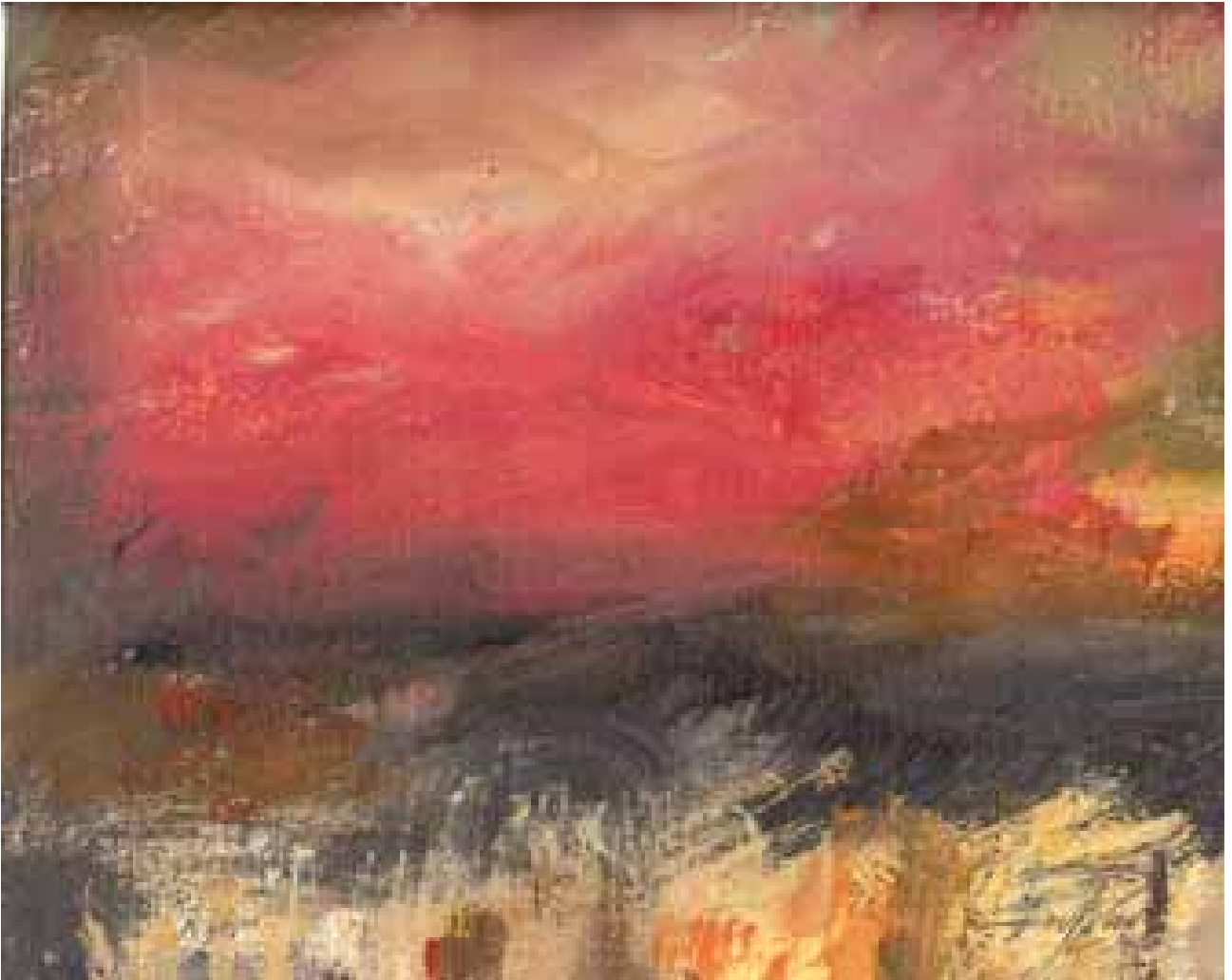
GÉNESIS óleo/cartón 70x100 cm