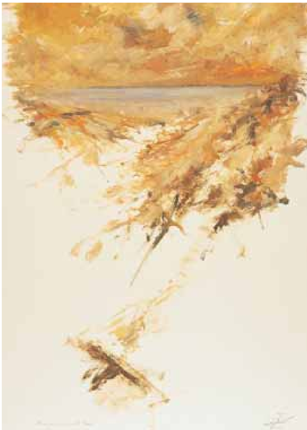
GÉNESIS óleo/cartón 100x70 cm