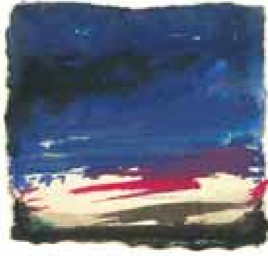
GÉNESIS acuarela/papel 8x8 cm

y los vínculos establecidos entre ellas. Y donde es fácil percibir que cada cuadro, independientemente de su tamaño, cada ínfimo gesto del pincel, la obtención de cada transparencia a través del color, la elección del motivo, contiene en una suerte de pirueta mágica el cuadro primigenio, el origen, el génesis que puso en marcha el mecanismo de creación del artista y, por tanto, todos sus cuadros futuros, trazos secretos, celajes y cúmulos nimbos, paisajes del espíritu, donde están representadas todas las posibles visiones plásticas del pintor.