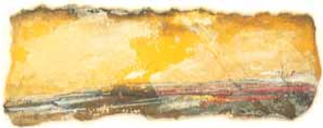
GÉNESIS acuarela/papel 6x17 cm