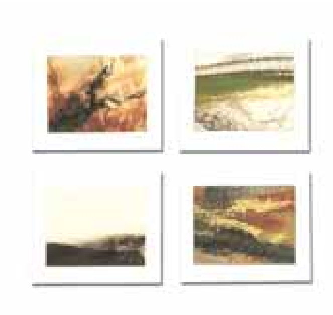
GÉNESIS FRISO V (41 piezas) óleo/papel 4'5x6 cm (cada una)