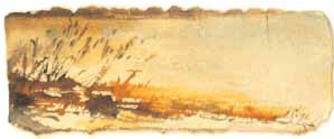
GÉNESIS acuarela/papel 6x17 cm

cambios atmosféricos en todas sus variantes y formas mediante una pintura que parece pura abstracción buscada y encontrada en la naturaleza. Son famosos los cielos de Madrid pintados por Velázquez; pero Cánovas se ha propuesto trasladar a sus lienzos las múltiples variaciones del aire desde el amanecer hasta la fabulosa puesta del sol e incluso la noche tenebrosa en su increíble riqueza cromática; porque la noche para Cánovas no es la oscuridad sin más, sino una oscuridad llena de matices.