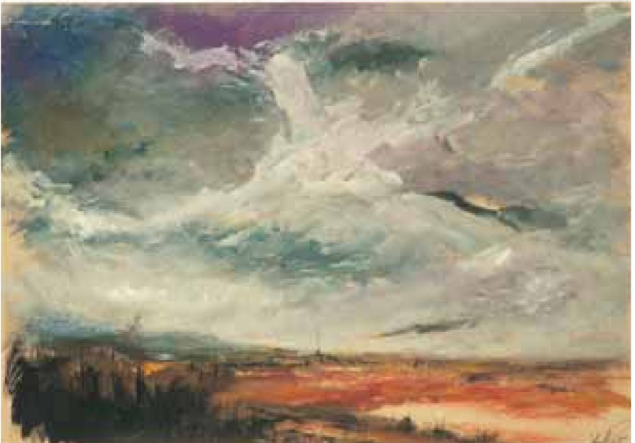
GÉNESIS óleo/papel 20x40 cm