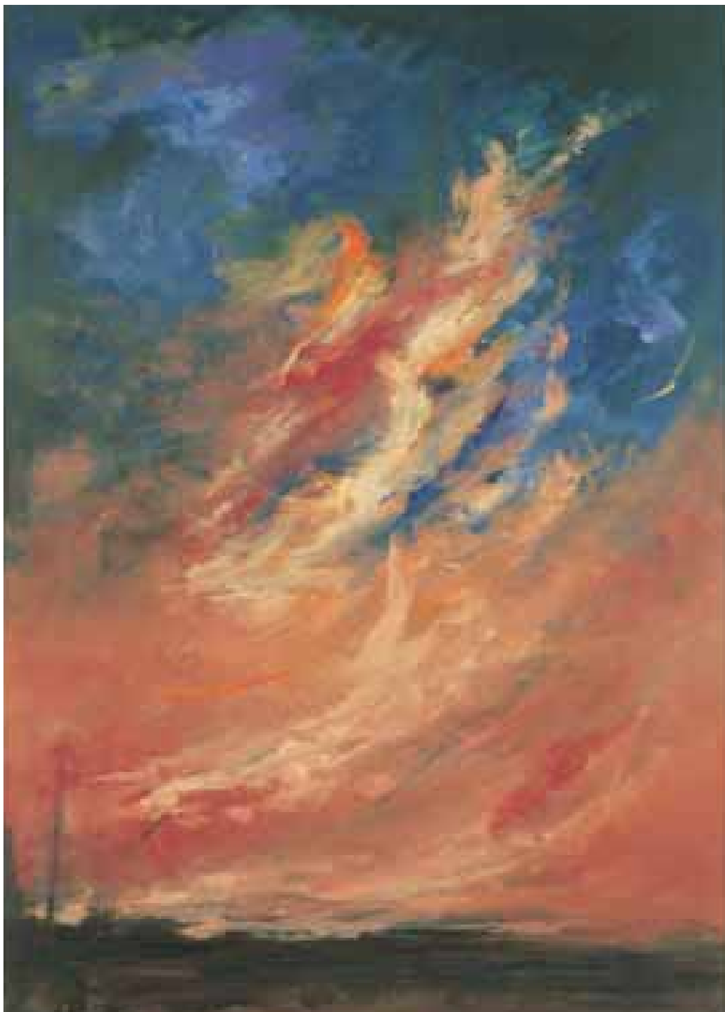
GÉNESIS óleo/cartón 100x70 cm