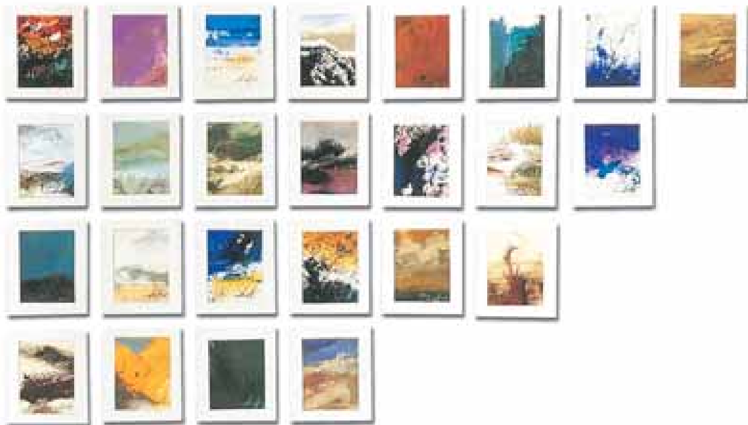
GÉNESIS FRISO III (46 piezas) óleo/papel 6x4'5 cm (cada una)