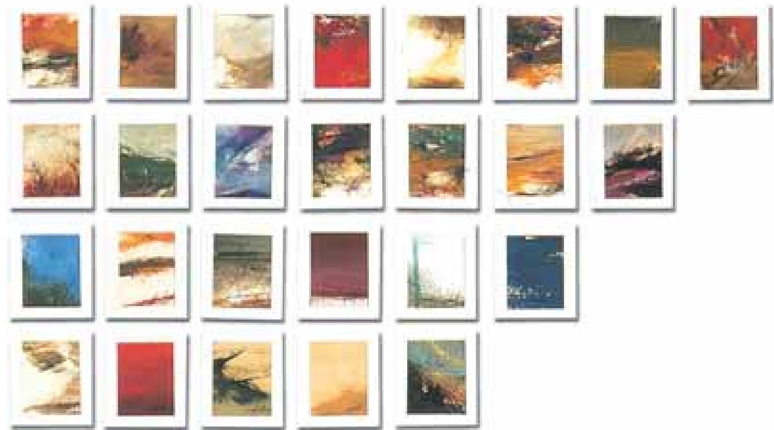
GÉNESIS FRISO VII (48 piezas) óleo/papel 4'5x6 cm (cada una)