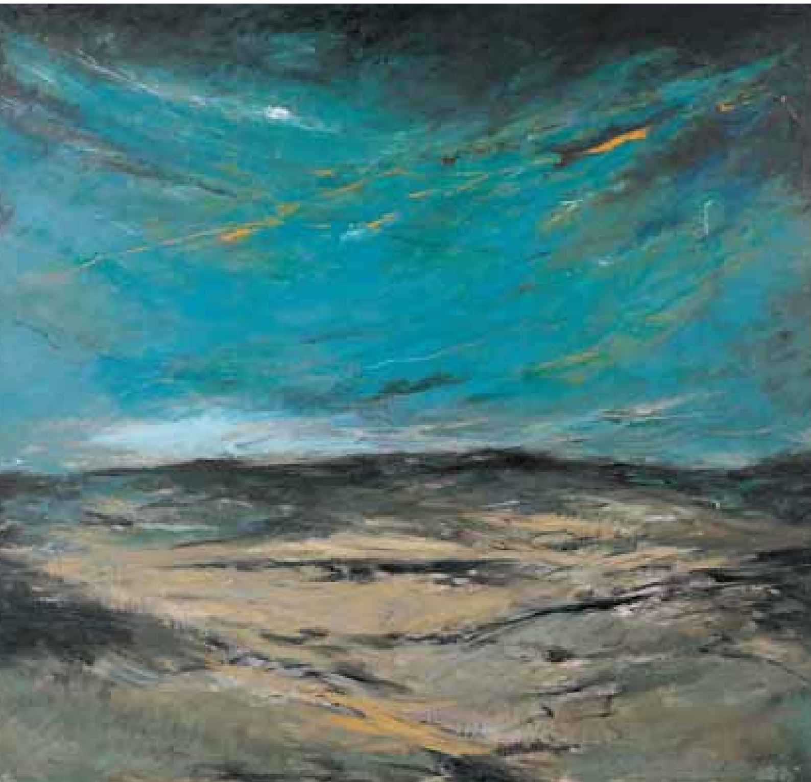
GÉNESIS TURQUESAS Y GRISES óleo/lienzo 162x162 cm