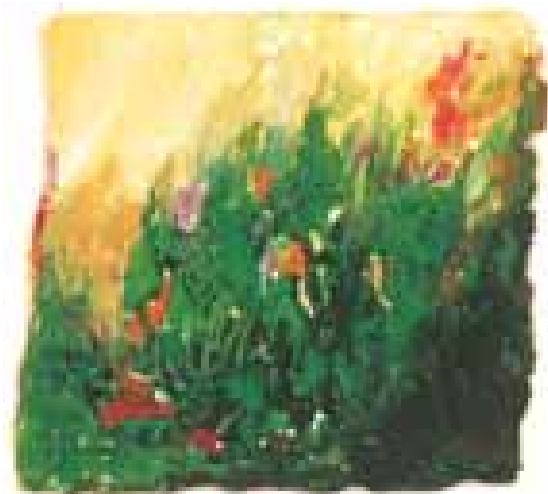
GÉNESIS acuarela/papel 11x16 cm

mejores exposiciones temporada. Palma de Mallorca.