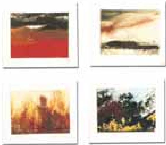
GÉNESIS FRISO I (44 piezas) óleo/papel 4'5x6 cm (cada una)