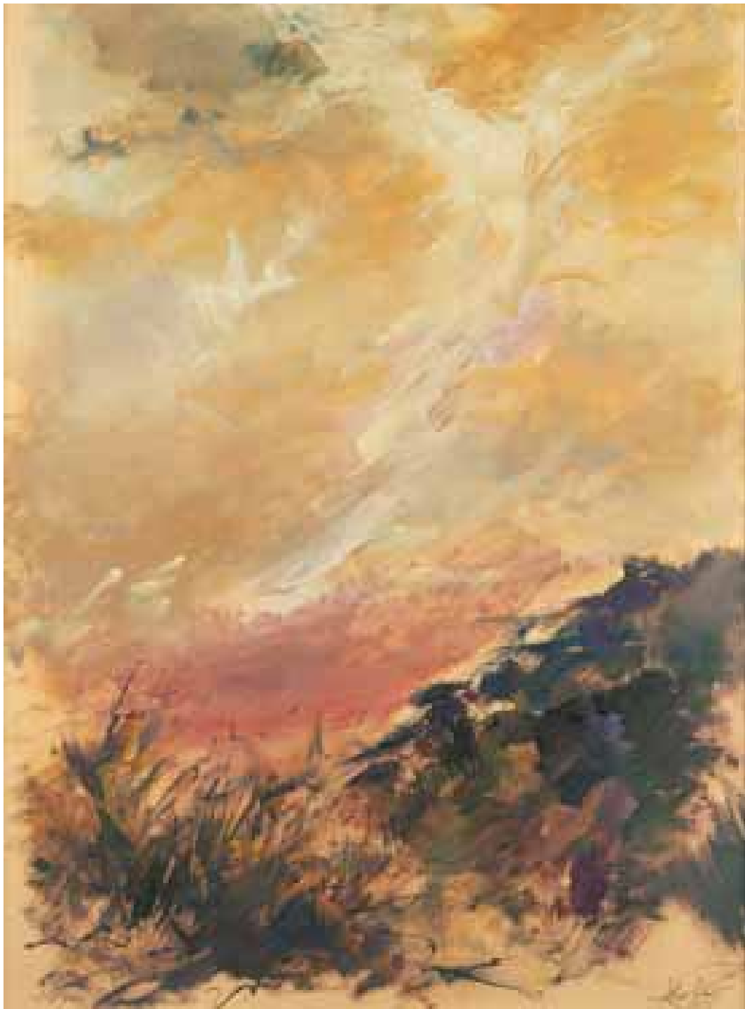
GÉNESIS óleo/cartón 100x70 cm