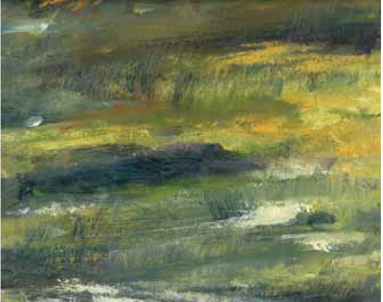
GÉNESIS óleo/cartón 70x100 cm