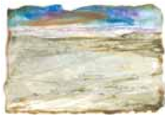
GÉNESIS acuarela/papel 11x16 cm