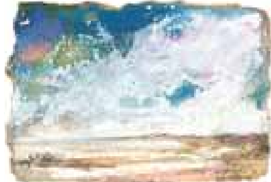
GÉNESIS acuarela/papel 11x16 cm

Puede Cánovas muy bien ser llamado el pintor del aire. Pero hay otra faceta deslumbrante en Cánovas y es el primor de sus dibujos de las cosas mínimas de la huerta como enternecidos secretos: unos ajos, unas cebollas, unos hinojos, exaltación de lo mínimo huertano sublimado por el arte, filigrana de lo humilde huertano, emocionante expresión de los productos más vulgares, convertidos por la sutil maestría del dibujo en joyas artísticas. Estos dibujos de la huerta son lo más murciano de la pintura y el dibujo sutil de Paco Cánovas. Por todo ésto Madrid se ha visto por unas semanas adornado de una pintura extraordinaria, manchas y color de voluptuosas ideas no claras pero evidentes, una pintura intelectual que de vez en cuando se baja hasta los frutos enternecidos de la huerta.