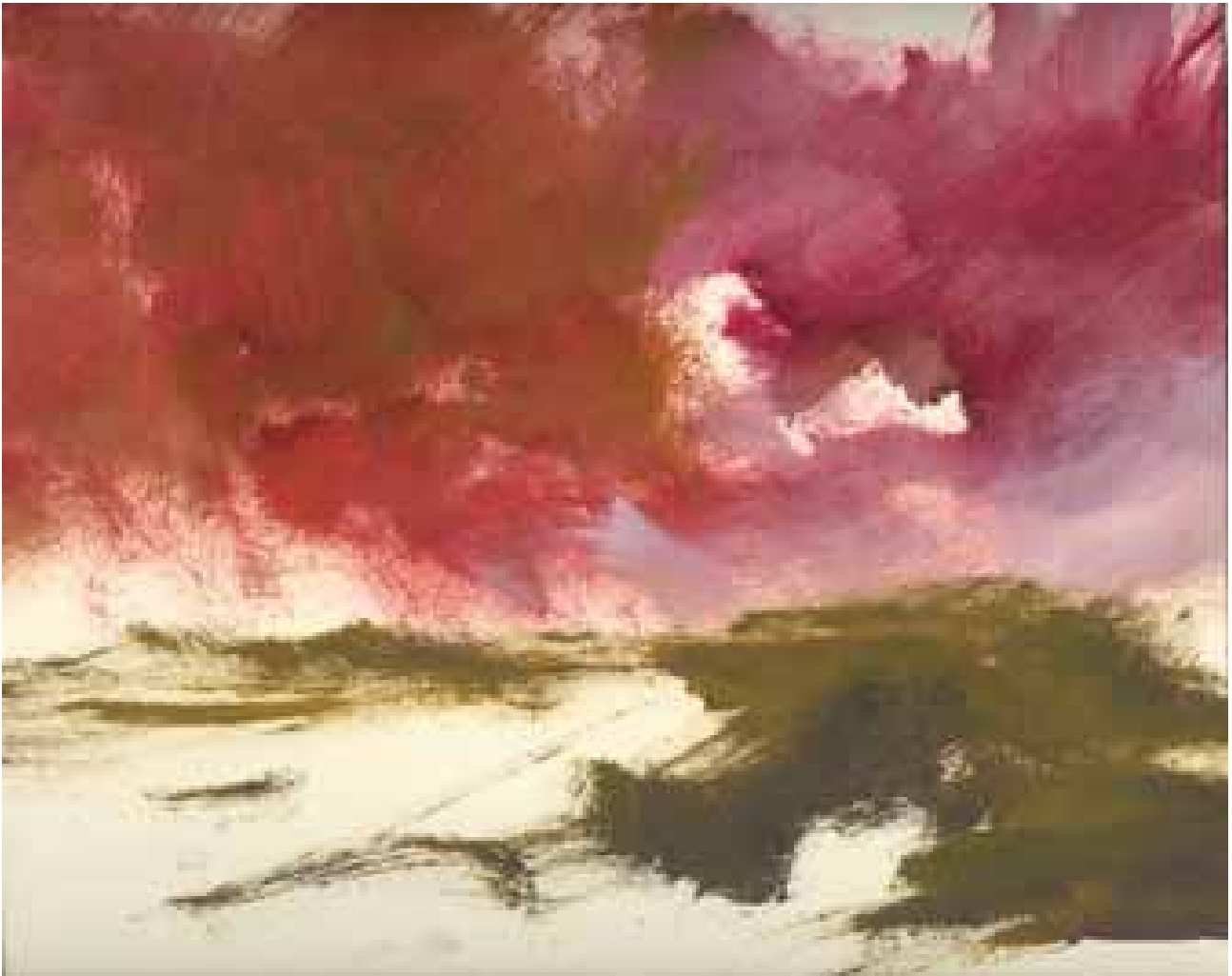
GÉNESIS óleo/cartón 70x100 cm