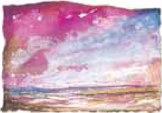
GÉNESIS acuarela/papel 11x16 cm