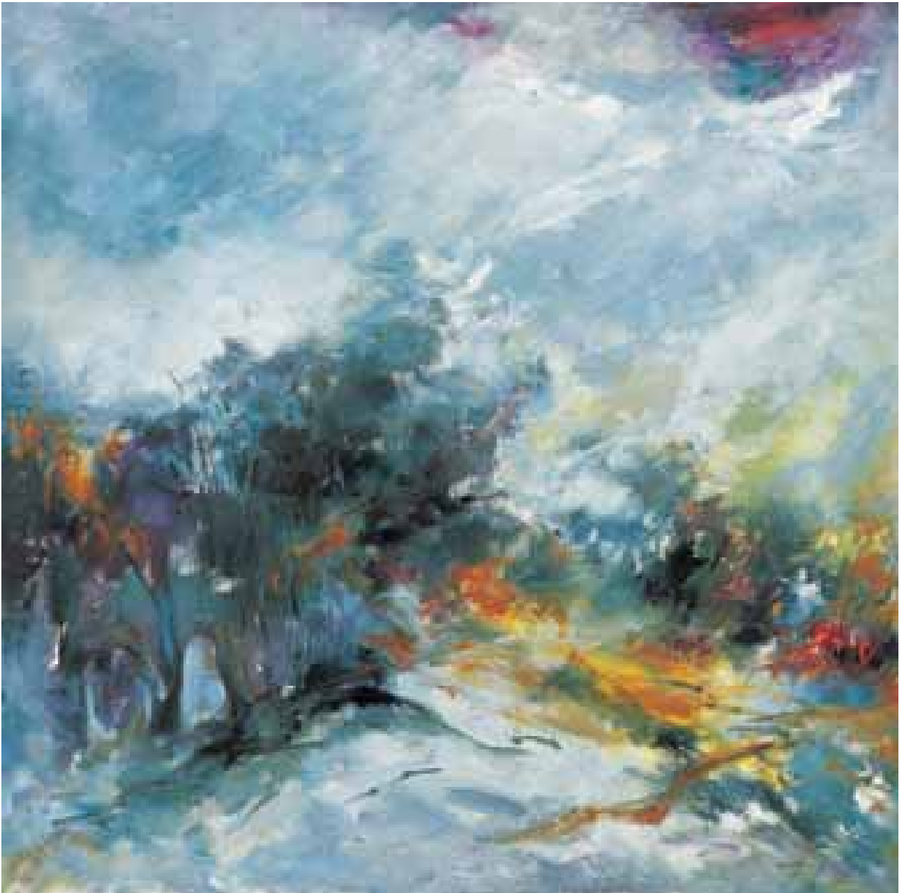
GÉNESIS EMOCIÓN I óleo/lienzo 100x100 cm