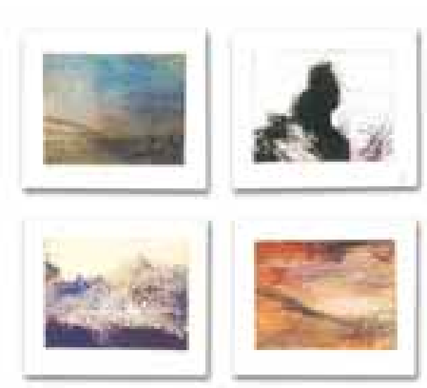
GÉNESIS FRISO VI (41 piezas) óleo/papel 4'5x6 cm (cada una)