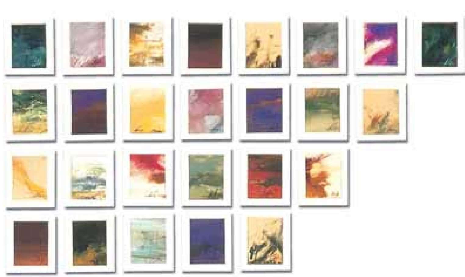
GÉNESIS FRISO II (48 piezas) óleo/papel 6x4'5 cm