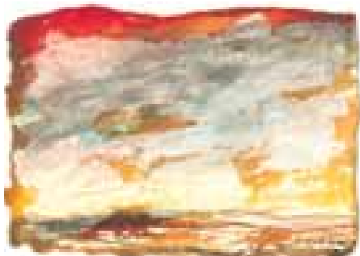
GÉNESIS acuarela/papel 11x16 cm