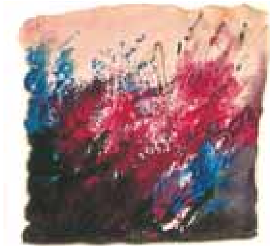
GÉNESIS acuarela/papel 11x16 cm

1985 Tercer premio Concurso Nacional de Pintura. Congreso de los Diputados. Madrid. Primer premio carteles Semana Santa. El Palmar, Murcia.