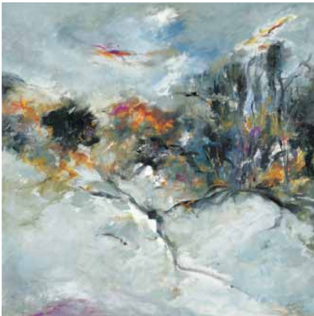
GÉNESIS EMOCIÓN II óleo/lienzo 100x100 cm