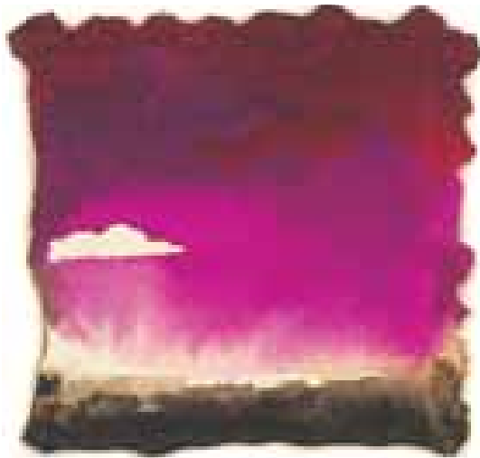
GÉNESIS acuarela/papel 8x8 cm