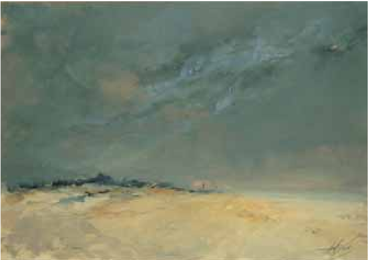
GÉNESIS óleo/papel 20x40 cm