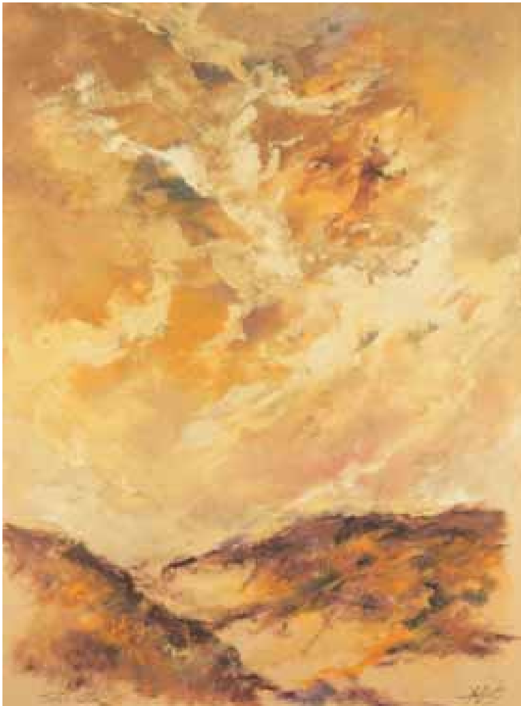
GÉNESIS óleo/cartón 100x70 cm