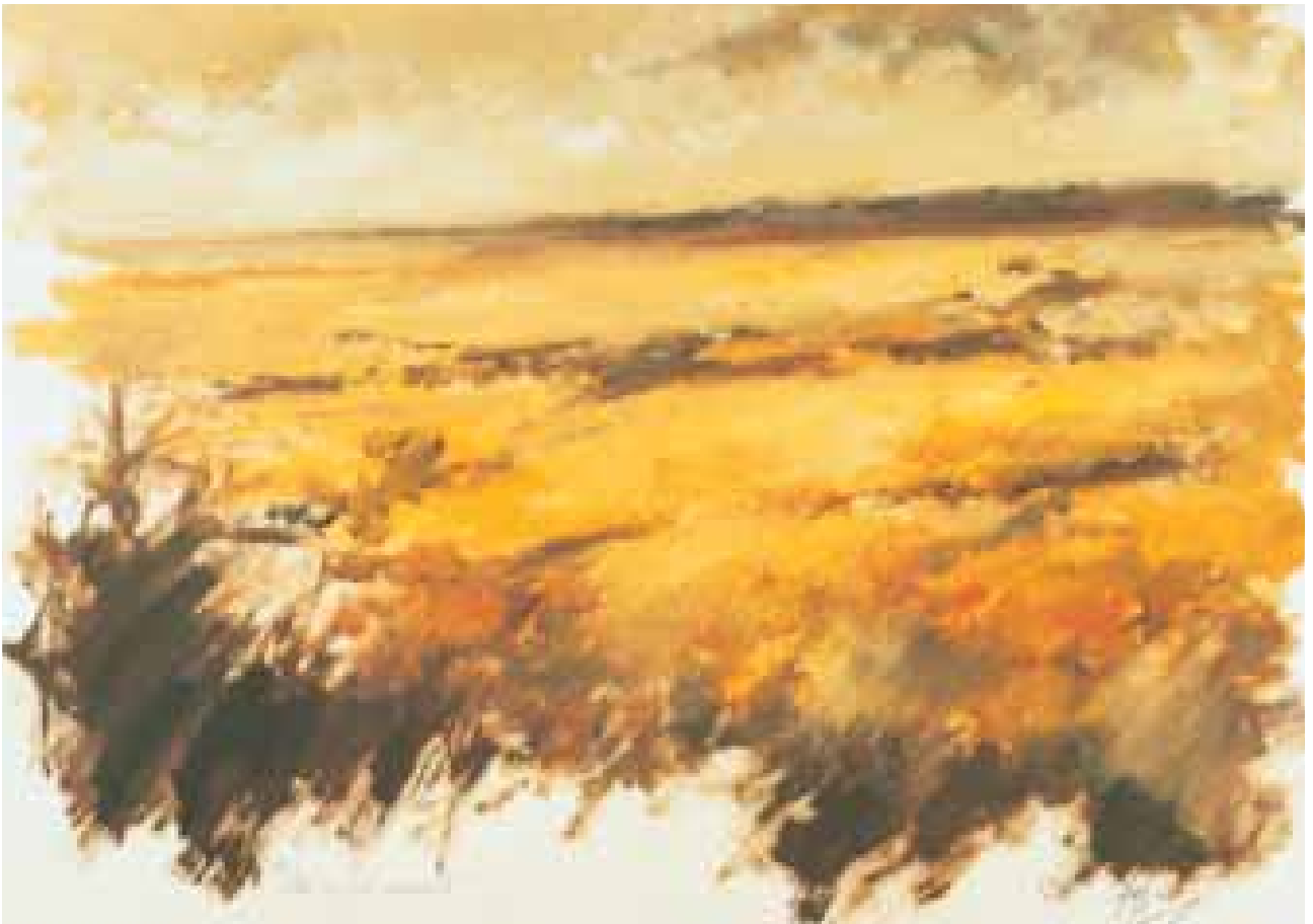
GÉNESIS óleo/cartón 70x100 cm