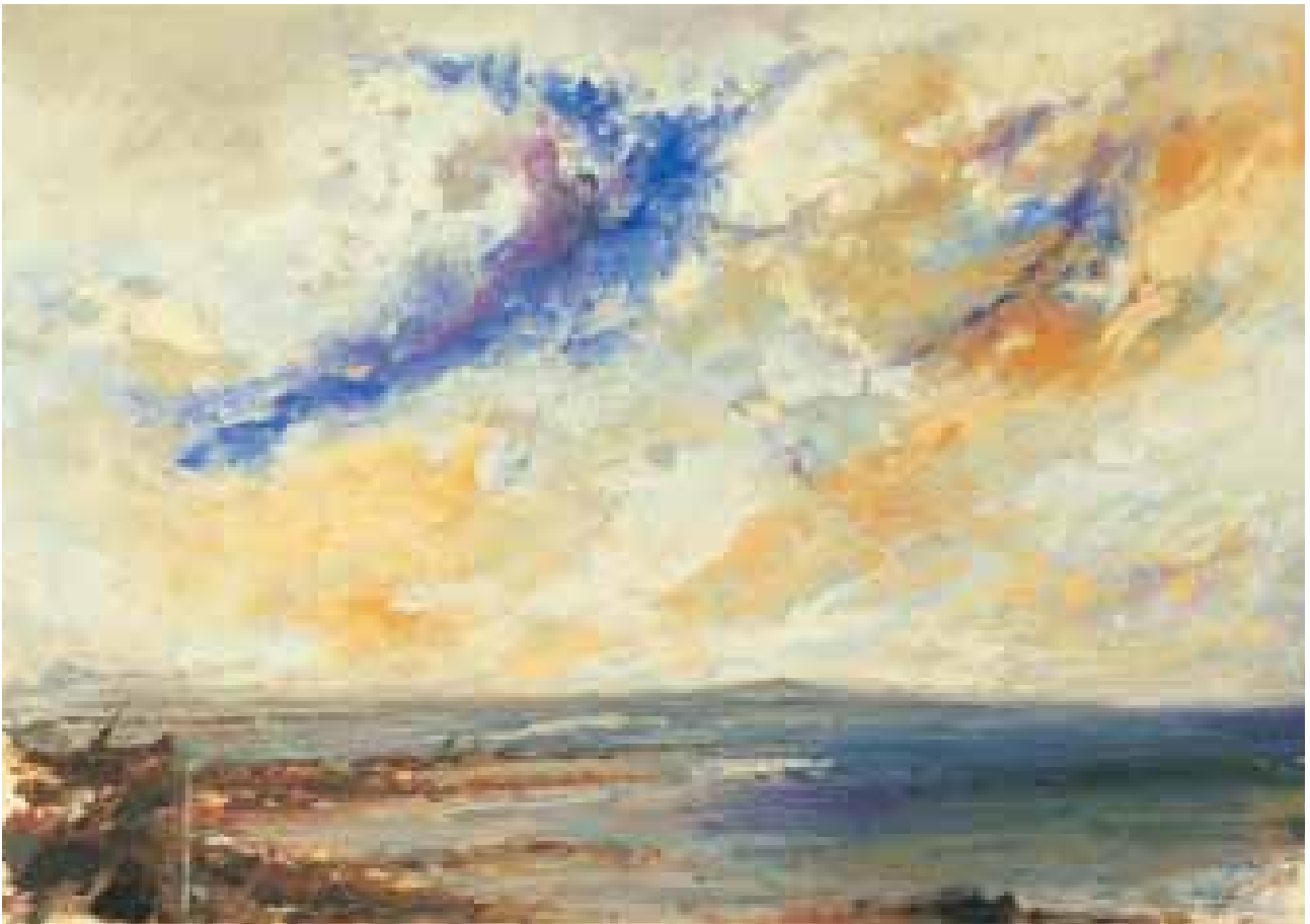
GÉNESIS óleo/cartón 70x100 cm